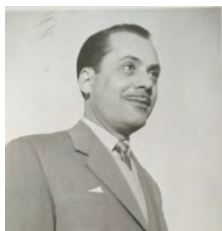
Nació el 1-4-1917