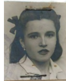
Nació el 5-12-1927